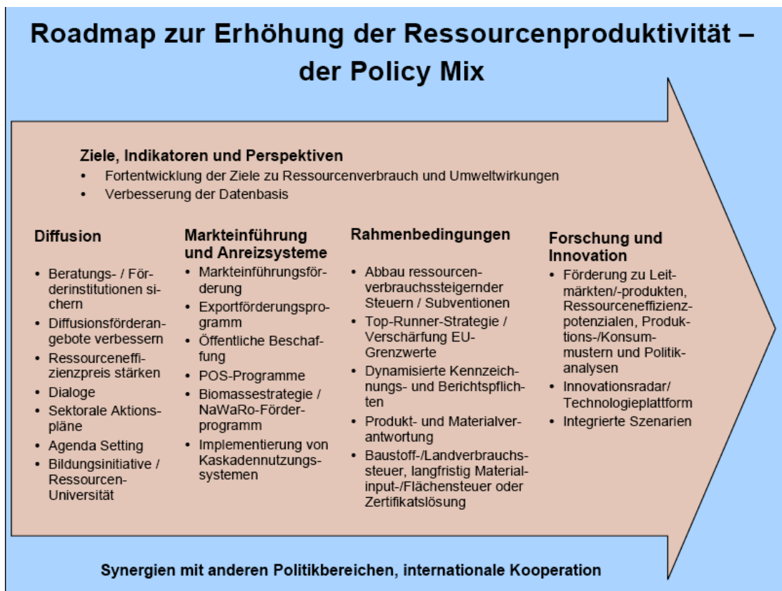
Abb. 2: Roadmap zur forcierten Steigerung der Ressourcenproduktivität