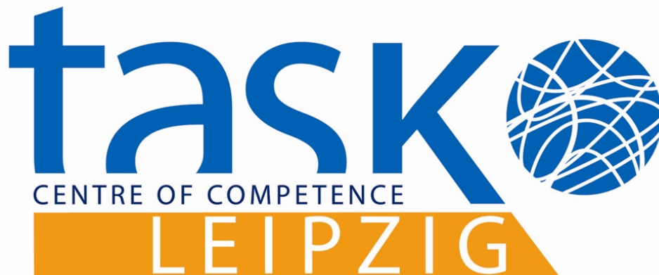
Abbildung 2: TASK Logo - zusammengesetzt aus Bild- und Wortmarke.

zentrum in den Bereichen Boden, Grundwasser und Flächenrevitalisierung, lokalisiert in Leipzig (Wortmarke). Ebenso unterstreicht das Logo den Netzwerkcharakter des Projektes (Bildmarke).