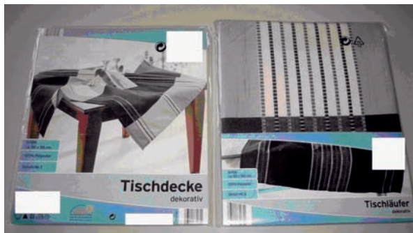
Abb. 2 bei der Lebensmittelkette beschlagnahmte Nachahmung