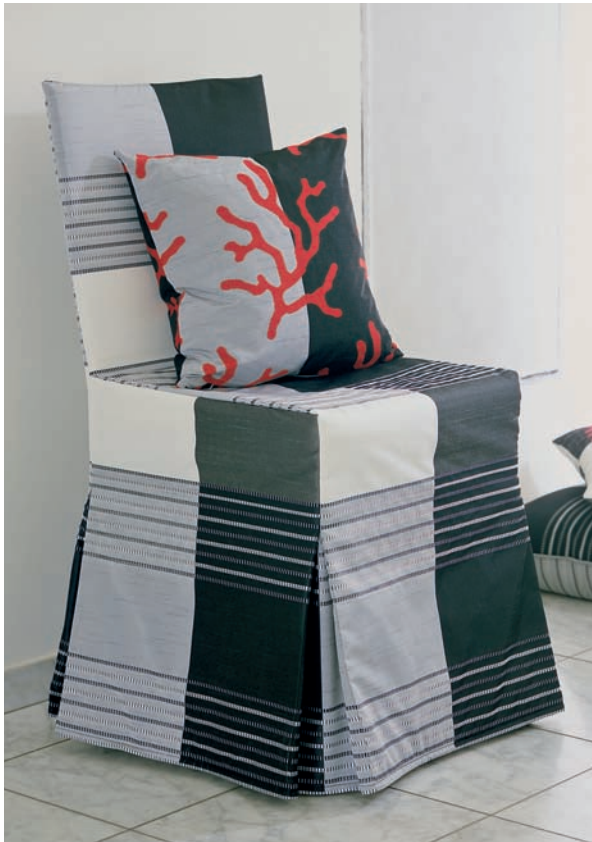
Abb. 1 Muster der Alfred Apelt GmbH (www.apeltstoffe.de)