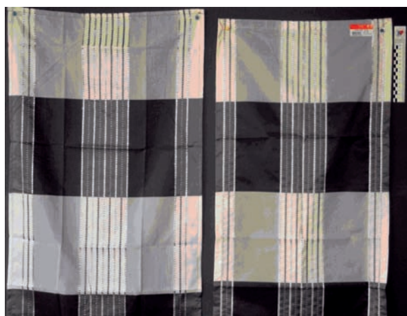
Abb. 3 Nachahmung